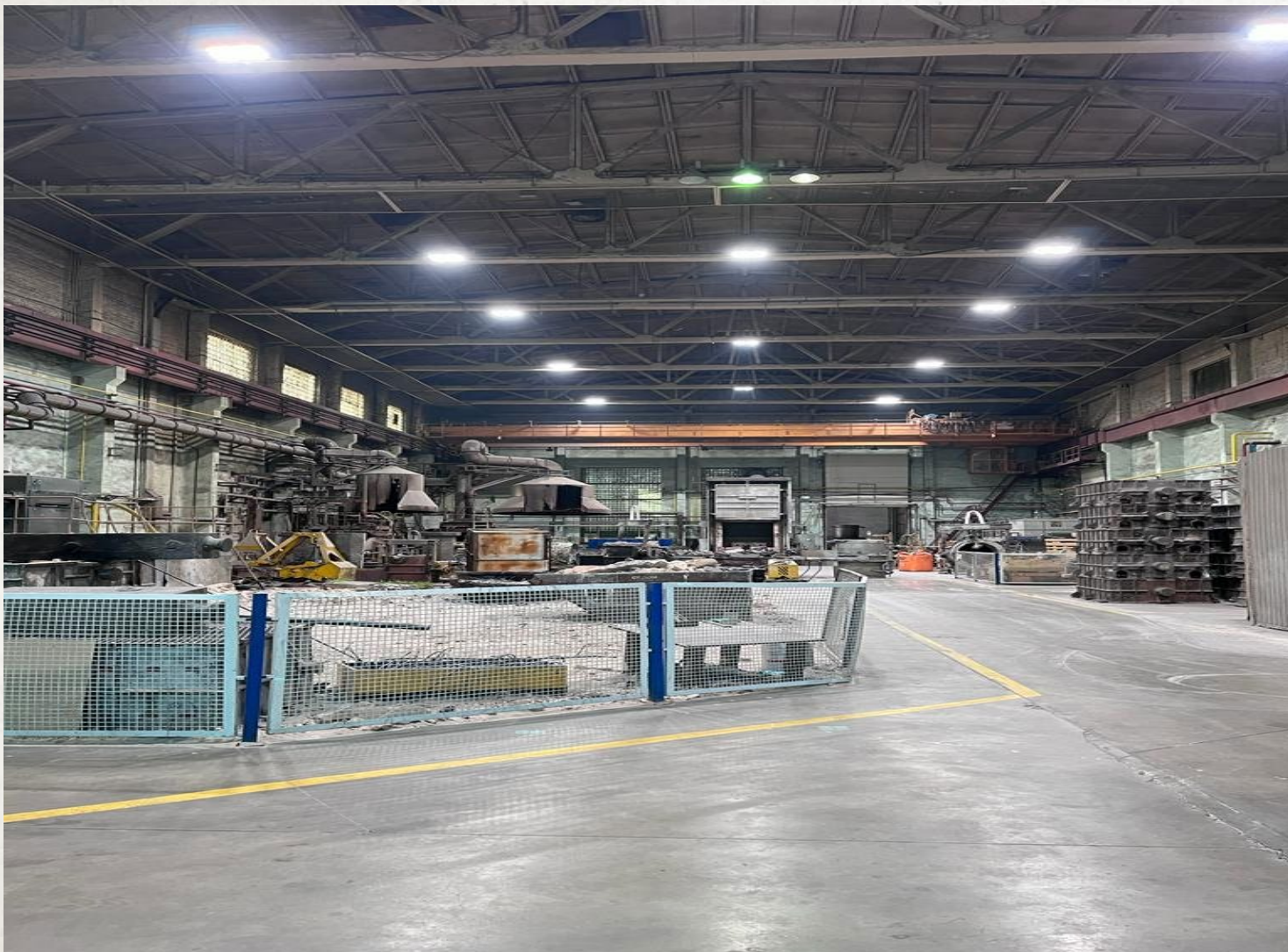
СМР И ПИР ПО СТРОИТЕЛЬСТВУ СИСТЕМЫ ЭЛЕКТРООСВЕЩЕНИЯ ЦЕХОВ 12,8/3,8.2 НА ТЕРРИТОРИИ АО «НЗЛ».